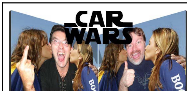
GP DE CHINE ET GP DU JAPON... QUI REMPORTE LES CHAMPIONNATS?