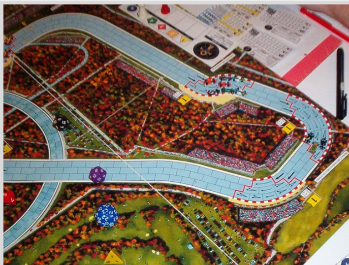
2) 1 er tour: enchaînement des trois virages, où on voit les voitures regroupées en deux peloton. Les deux voitures K&D luttant en tête avec Arsenic33 alors que le second peloton est dominé par les deux voitures Circus.