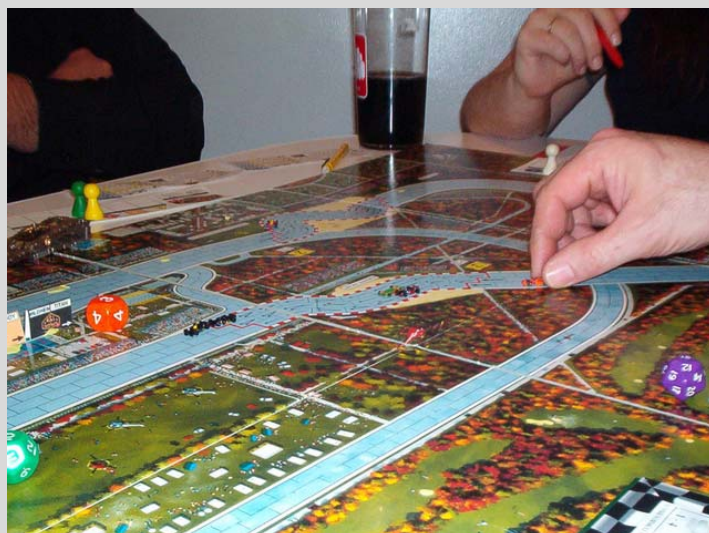
4) Fin de la course: Les deux voitures K&D viennent de sortir de la chicane avant de filer à vive allure sur la droite qui les conduira au dernier virage. Derrière, Le Bourreau joue son coup (avec l'aide de La Main); il finira 4 e .