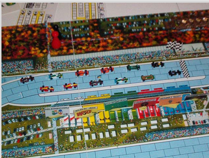
1) La grille de départ avec les deux voitures K&D devant, les deux Weedheater juste derrière et une Resurrection à la toute fin de la grille!