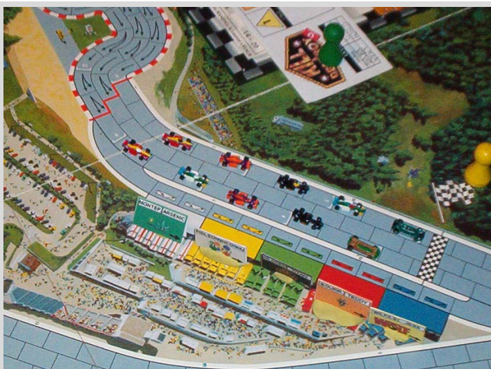
1) Photo de la grille de départ vue du haut!