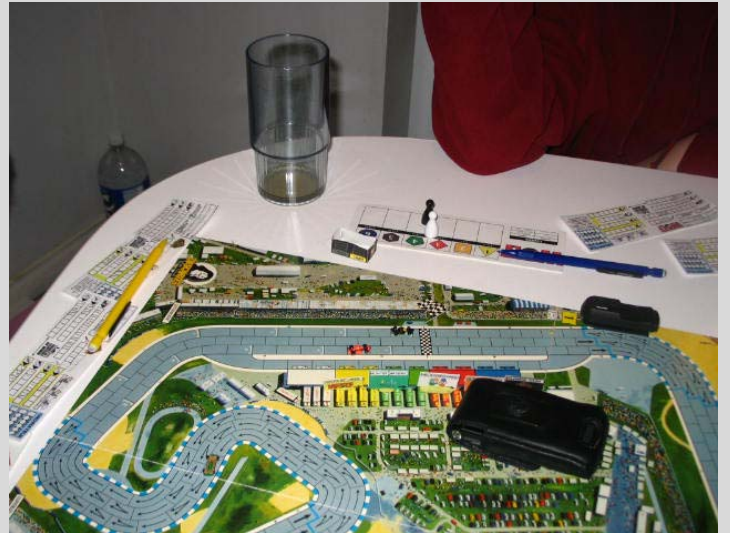
4) Fin de course serrée: Titan termine devant Teddy. Ils sont suivis par Arsenic33 en 3 e place.