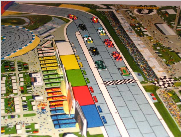
1) Départ vu d'en haut de la première courbe, à environ 40 degrés par rapport au plan de la piste. Ouf!