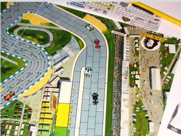
5) Dure lutte pour les derniers points: Selon Steffe, ce fut presque le moment le plus excitant de la course!!