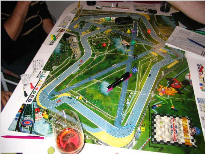
3) Allure du 2 e tour: Les groupes sont dispersés, Nelson en tête-à-queue, Wildheim tout juste devant les Wolf, tout a changé.