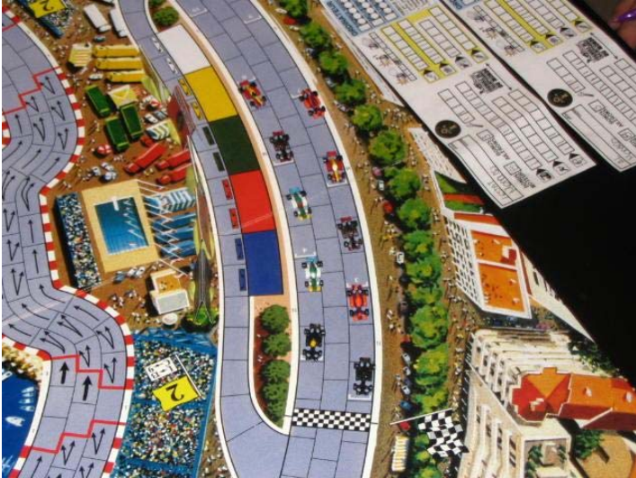
1) Le départ: Belle photo!! On s'y croirait!!