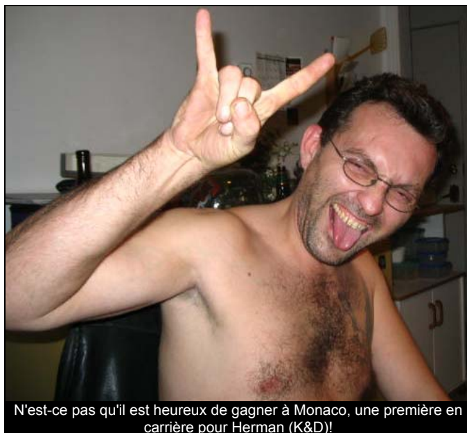
N'est-ce pas qu'il est heureux de gagner à Monaco, une première en carrière pour Herman (K&D)!

FORMULE PROUT EXPRESS REPREND LES REPORTAGES, COMMENTAIRES ET PHOTOS PUBLIÉS SUR LE SITE DE LA COMMUNAUTÉ PROUT. POUR DES COMMENTAIRES/SUGGESTIONS: