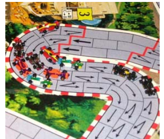
3) 1 er tour, 5 e virage: Toutes les voitures y sont!! Les K&D en sont rendues à leur 2 e arrêt, les autres au premier.