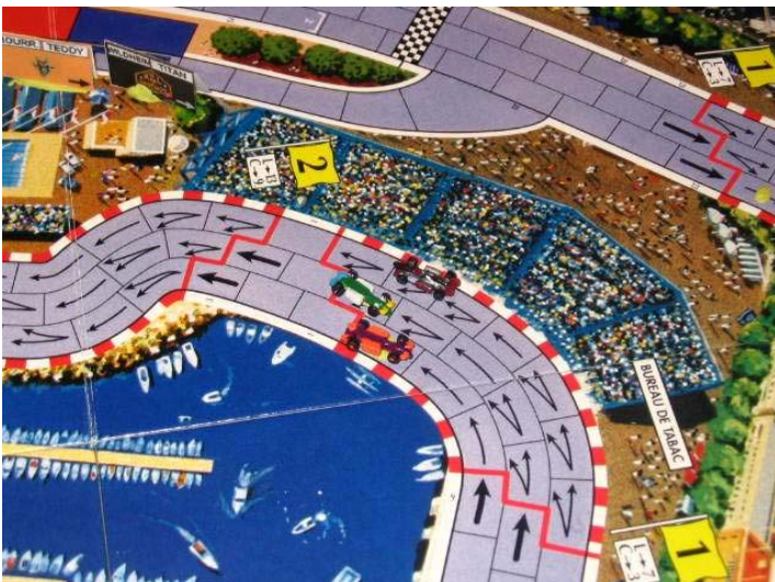
6) Double accident: Contact entre Nelson et LeBourreau qui résulte en double accident!! La pluie a fait ses ravages: 3 e et 4 e victimes...