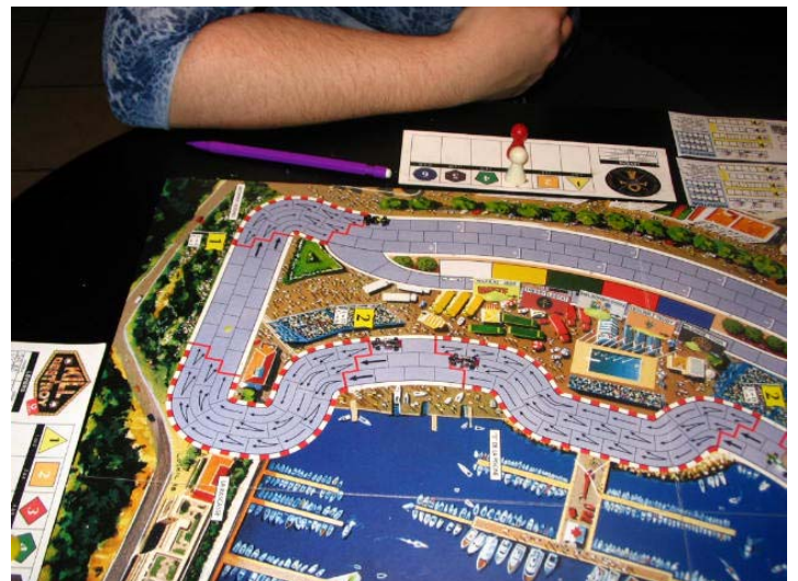
8) Les 3 premiers: Titan en avant, les deux voitures de Resurrection qui suivent plus loin. À l'extrême droite, bien loin, la voiture de Circus.