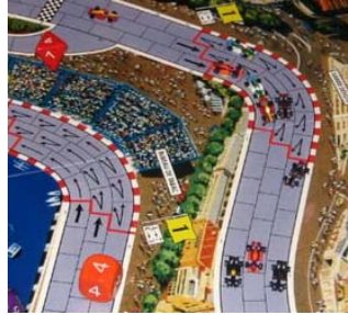
2) 1 er tour, 1 er virage: Ça commençait à se bousculer et ça allait devenir pire...