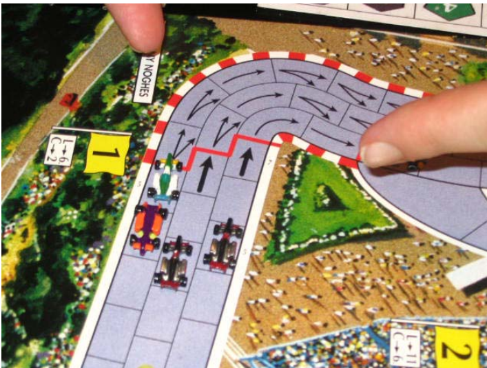
4) Teddy out: Pointé du doigt par d'autres participant joyeux, voici la voiture accidentée de Teddy, première victime de la course.