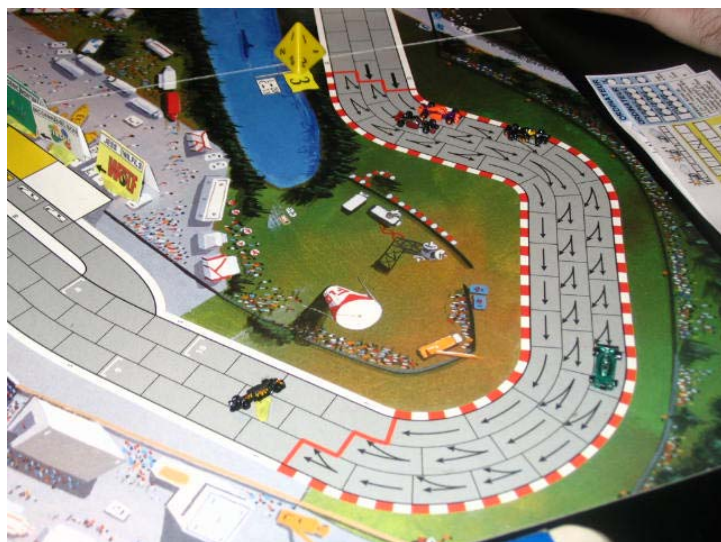
7) Wildheim en sortie de piste: Fin du 2 e tour, le meneur sort de piste, n'ayant fait que 2 des 3 arrêts de la dernière courbe sous la pluie!