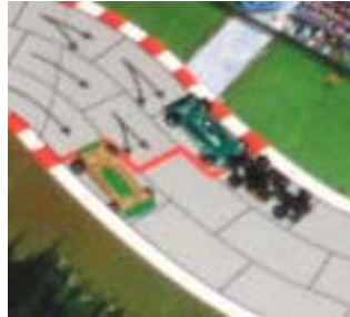
3) Les meneurs du 1 er tour: Les 2 voitures de Weedheater avec Wildheim de K&D.