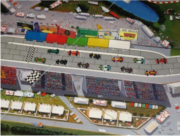
1) Le départ: notez la première ligne toute "Weedheatienne" (merci pour le mot, Yves lol)