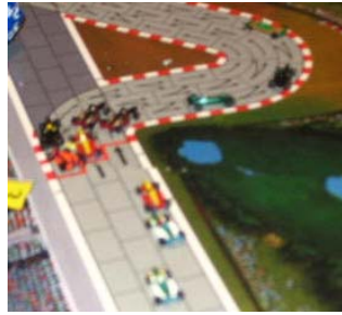
2) 1 er tour, 1 er virage: Un peu de bousculade mais tout était bien propre malgré tout.