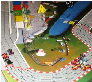
5) Fin du 1 er tour: Même positions que la photo précédente mais avec vue sur les puits.