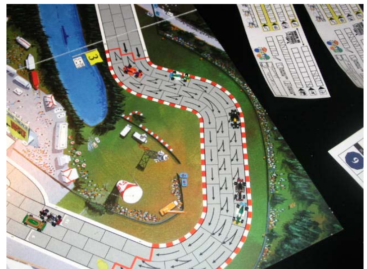
8) Fin de course, les positions 2 à 8: LeBourreau et les 2 voitures Wolf sont trop loin pour être sur la photo!! Teddy dépassera Nelson pour la 7 e place! Photos et commentaires: Yves Gosselin.