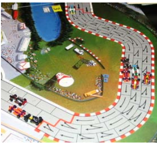
4) 2 e et 3 e peloton: C'est vers la fin du premier tour. Les pilotes de Circus sont encore à l'arrière parce qu'ils ont subi des blocages durant ce tour (et le reste de la course)!!