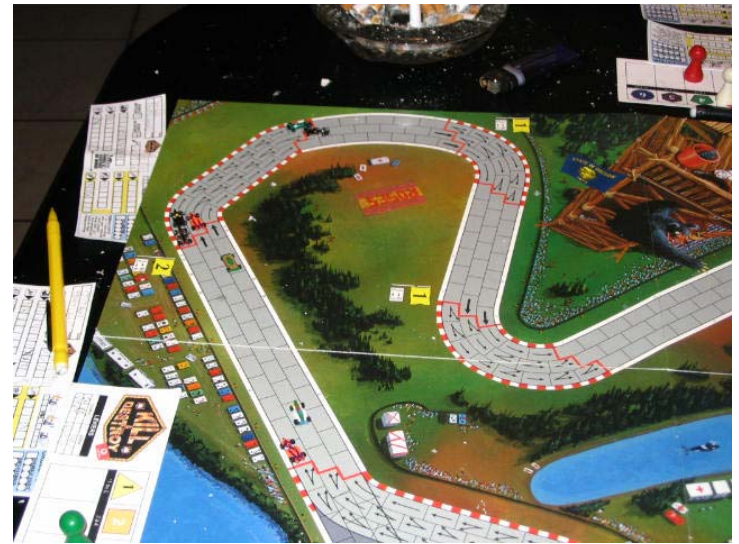
6) Début du deuxième tour: Les groupes sont un peu plus dispersés...