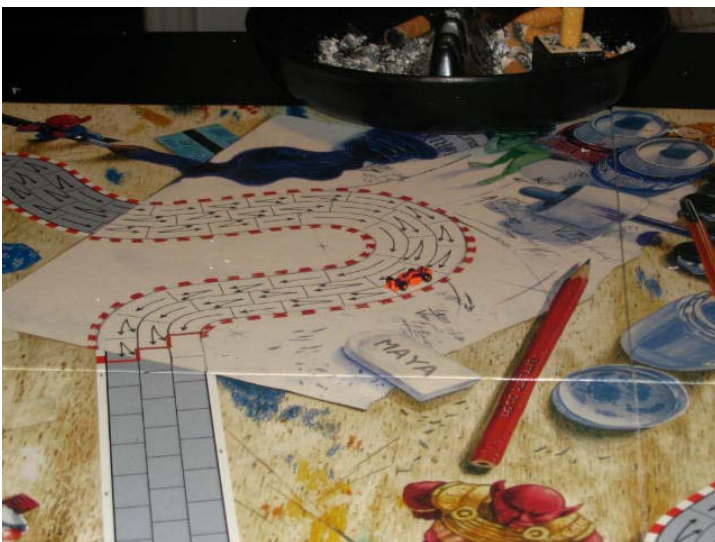
5) Le pilote de DMS, Le Bourreau, fait sa course bien tranquillement en dernière place et à 7 coups du meneur!