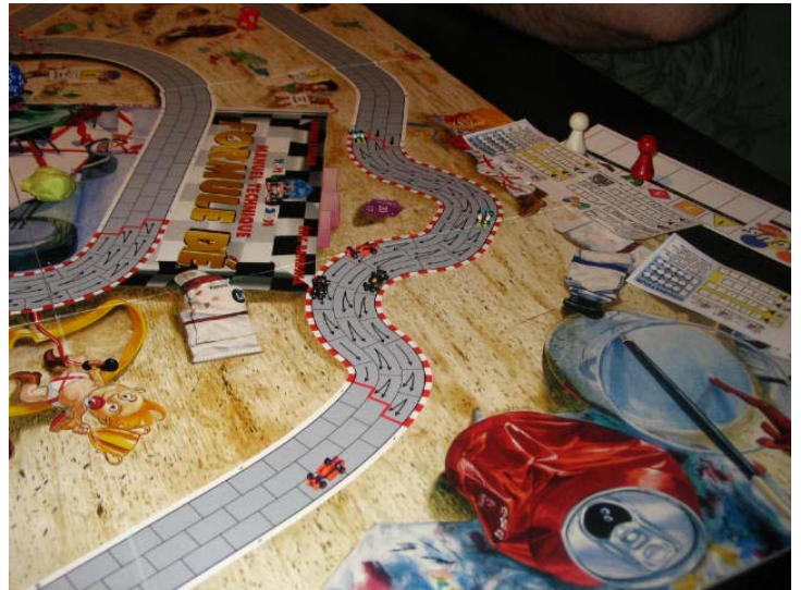
2) 1 er tour, 5 e virage: tous les pilotes dans le même tour, avec Teddy en avant!