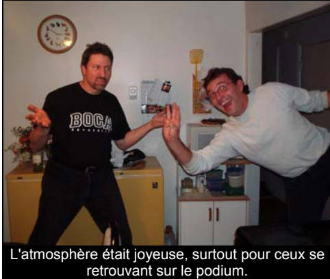
L'atmosphère était joyeuse, surtout pour ceux se retrouvant sur le podium.

8 oct. 2005 Quelque part en Europe avait lieu le 2e GP des Nations-Unies sur le circuit du 10e anniversaire de Formule Dé, troisième épreuve de la saison 9.