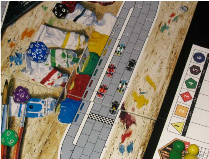
1) Départ, avec Titan à la pole position.