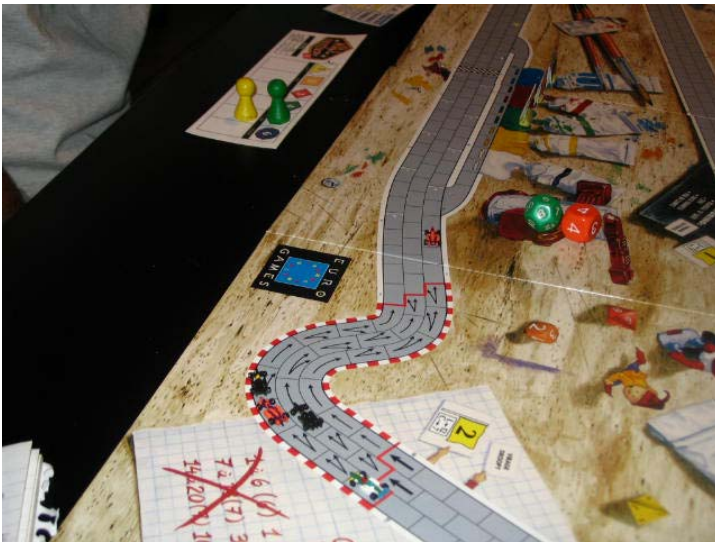
3) Fin du premier tour: les positions ne changent guère. L'autre pilote de Circus viendra se joindre au groupe après la prise de la photo.