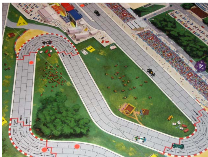
Début du 2 e tour: les concurrents se distancent.