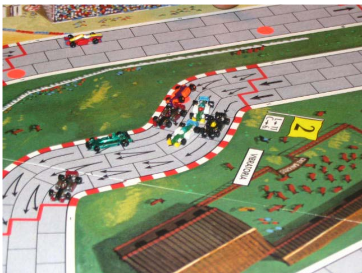
Première victime: Le Bourreau entre trop vite dans le virage, donnant le résultat que l'on voit.