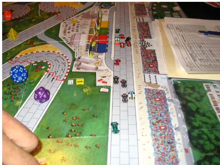
Départ chaotique: des changements de position, des moteurs calés et un accrochage.