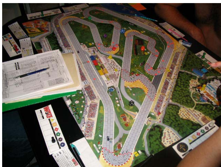
Fin du 2 e tour: 6 voitures en piste, il n'en restera que 4 à la fin.