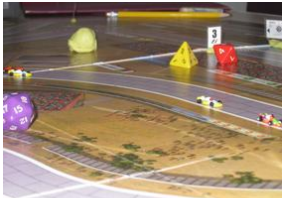
1 er tour, ligne droite après le 2 e virage: Rotten en tête suivi de Poubel (Circus), Icekønen et Badminton (Nightmare-FMW), tous dans le même coup.