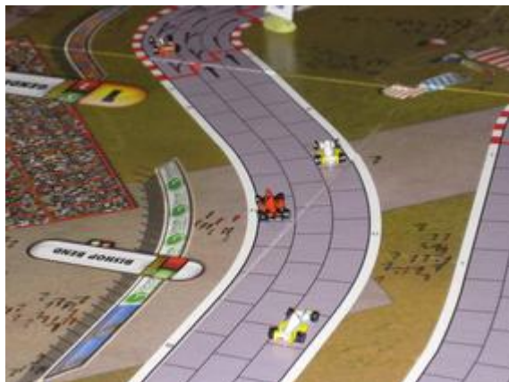
1 er tour, 6 e virage: Rotten maintenant seul en tête.