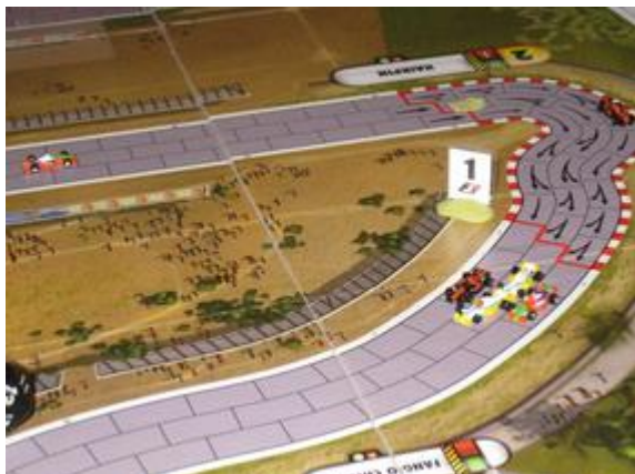
1 er tour, 3 e virage: toujours les mêmes meneurs et l'arrivée de Mortis en 6 e place.