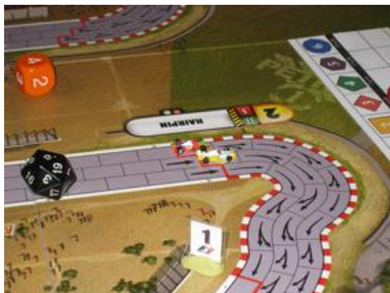
3 e tour, 3 e virage: Poubel et Mortis, la lutte pour la seconde place...