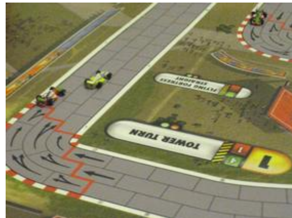
3 e tour, 5 e virage: au tour de Poubel de prendre l'avantage, avant de faire une sortie de piste au virage 7.