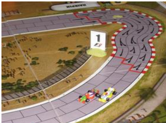
3 e tour, 3 e virage: à la sortie du virage, Mortis prend l'avantage.