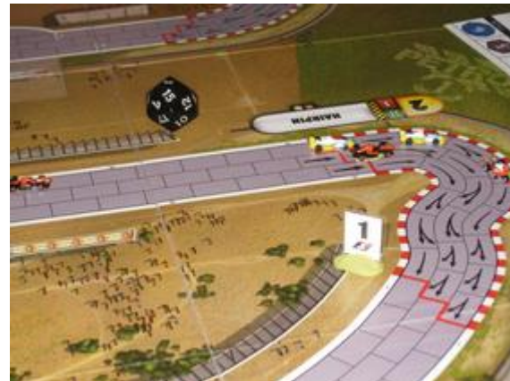
1 er tour, 3 e virage: toujours le groupe des quatre, la seconde Nightmare en 5 e place.