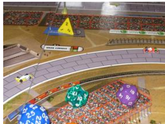
2 e tour, ligne droite après le 2 e virage: Icekønen à la poursuite de Rotten.