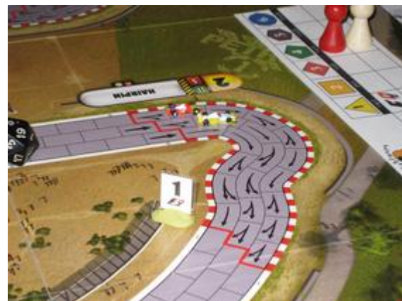
3 e tour, 3 e virage: ils avaient oublié leurs glissades au coup précédent (?) à cause de la pluie!