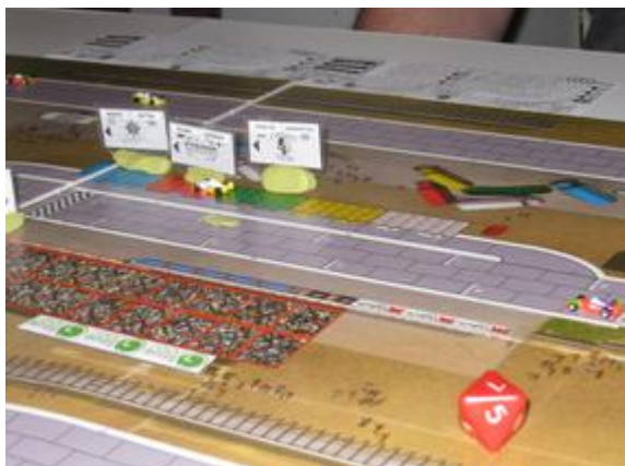
2 e tour, sortie du 8 e virage: Icekønen aux puits, suite à sa sortie de piste. Rotten seul en tête avec en arrière plan les autres Circus et Dungeon.