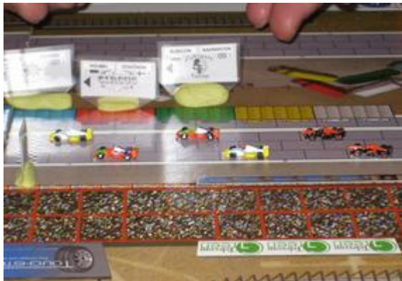
La ligne de départ, dans l'ordre: Icekønen (Circus), Rotten (Dungeon-Circus), Mortis (Dungeon-Circus), etc...