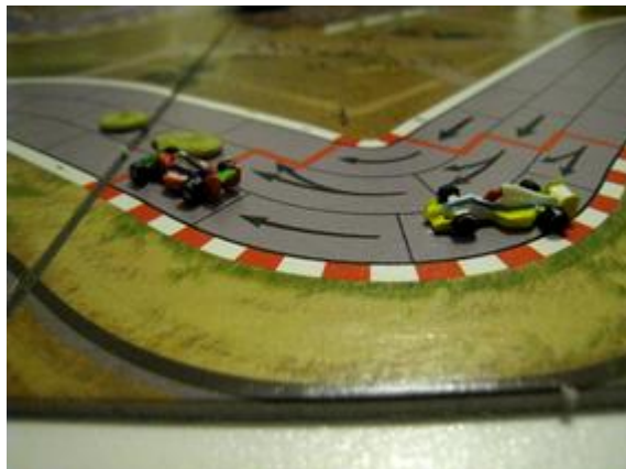
3 e tour, 4 e virage: toujours la lutte pour la seconde place entre Mortis et Poubel.