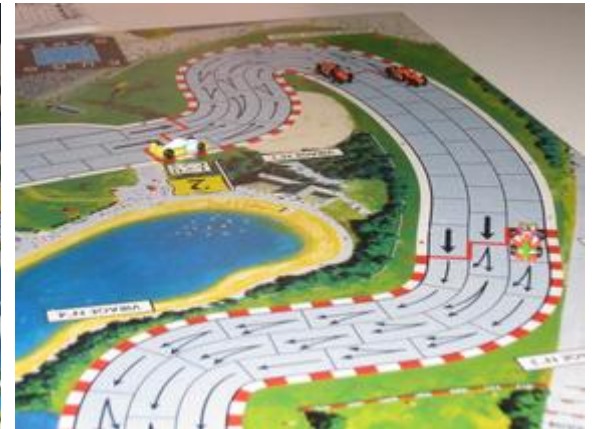
2 e tour, 1 er virage: les deux Nightmare viennent de passer devant Choumachier. Mortis en tête.