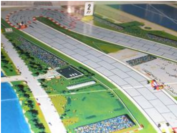
1 er tour, 5 e virage: Toujours Mortis en tête, devant Rotten (Dungeon-Circus) et Choumachier (Circus).