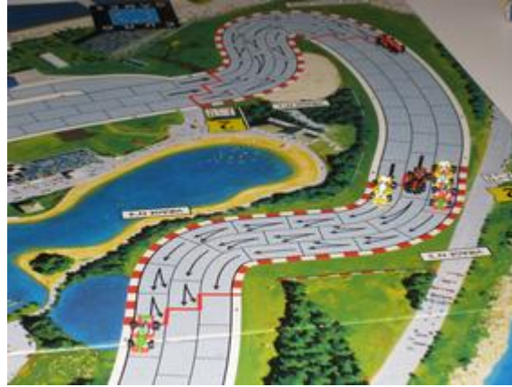
1 er tour, 2 e virage: Mortis (Dungeon-Circus), 2 e arrêt et 4 autres pilotes au premier arrêt.