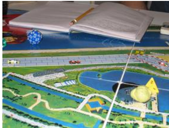
1 er tour, 6 e virage: Encore Mortis en tête et les mêmes pilotes derrière...