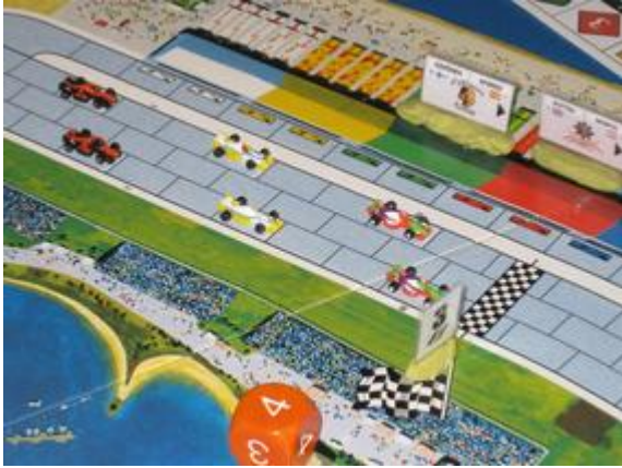
1 er ligne de départ, dans l'ordre: Dungeon, Circus et Nightmare.