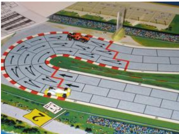
2 e tour, 5 e virage: Choumachier à la poursuite de Afonso (Nightmare-Toyopa).