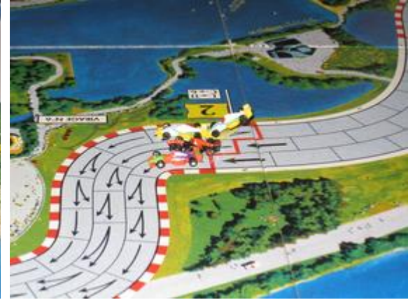
1 er tour, 3 e virage: Poubel bloqué par Choumachier (les deux Circus). Près d'eux, Mortis et Icekönen (Nightmare-Toyopa).