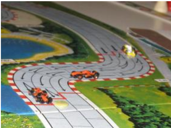
2 e tour, 2 e virage: incroyable, mais les deux Nightmare sont toujours devant Choumachier.