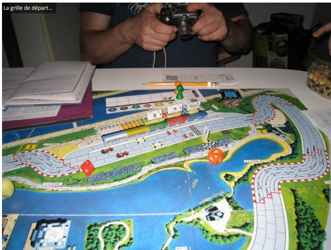
La grille de départ...