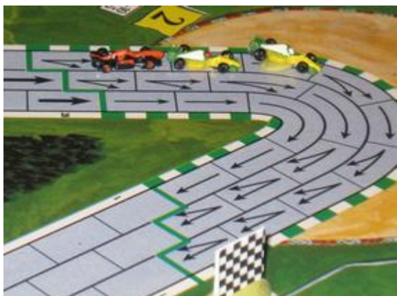
2 e tour, 2 e virage: ils sont maintenant trois à se faire la lutte pour la seconde place, Choumachier, Poubel et Afonso.