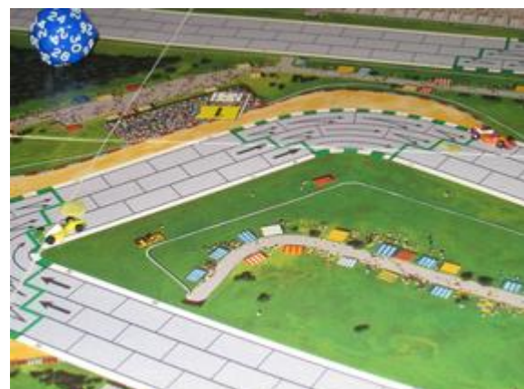
3 e tour, 3 e et 4 e virages: Mortis en tête suivi de Poubel.