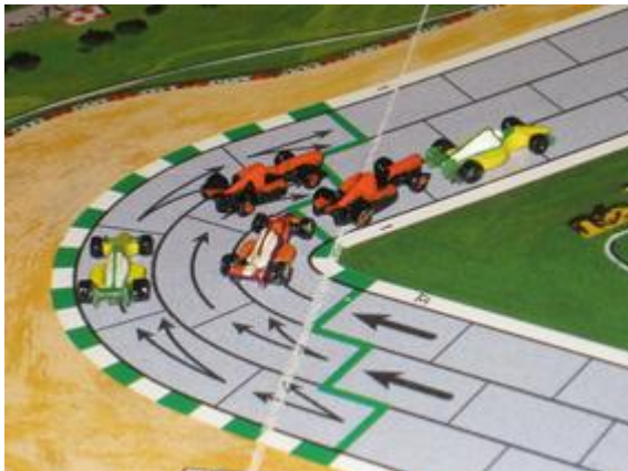
1 er tour, 3 e virage: lutte pour la seconde place entre 5 pilotes. Mortis est à un coup devant.