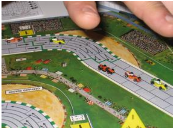
1 er tour, 1 er virage: Choumachier (Circus) suivi de Mortis (Dungeon-Circus) et Afonso (Nightmare-Toyopa).