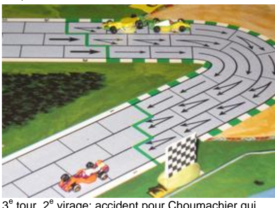
3 e tour, 2 e virage: accident pour Choumachier qui s'approche trop près de son coéquipier Poubel. Mortis toujours en tête avec un coup d'avance.