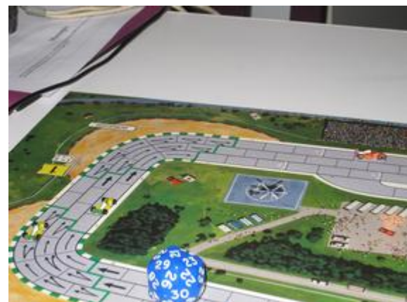
2 e tour, 8 e et 9 e virages: les deux Circus à la poursuite de Mortis.