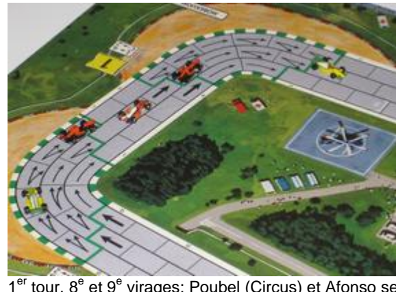
1 er tour, 8 e et 9 e virages: Poubel (Circus) et Afonso se partagent la seconde place. Rotten (Dungeon-Circus), Icekõnen (Nightmare-Toyopa) et Choumachier suivent avec un coup de retard.