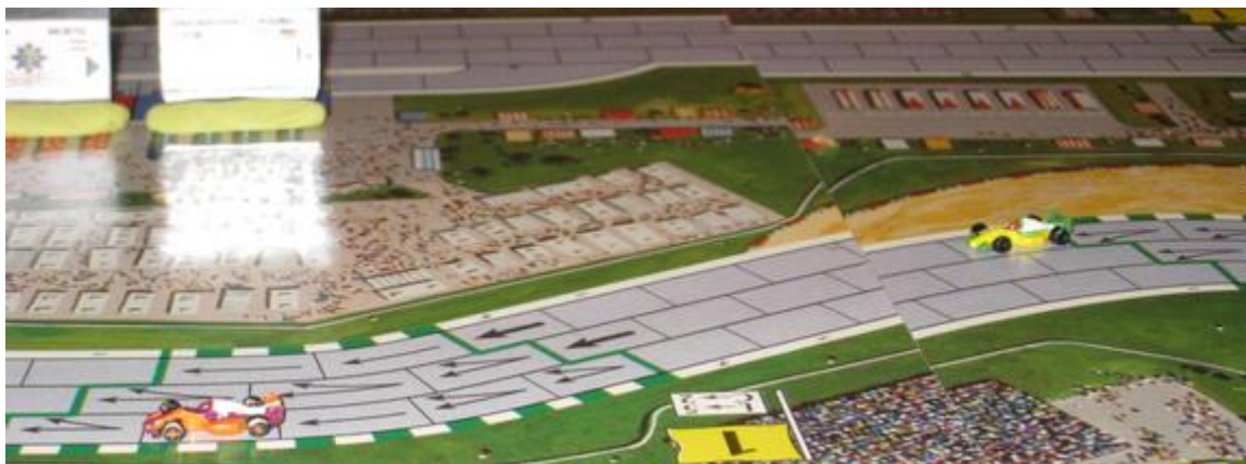
3 e tour, 6 e et 7 e virages: toujours Mortis en tête suivi de Poubel en seconde place, un coup les sépare.