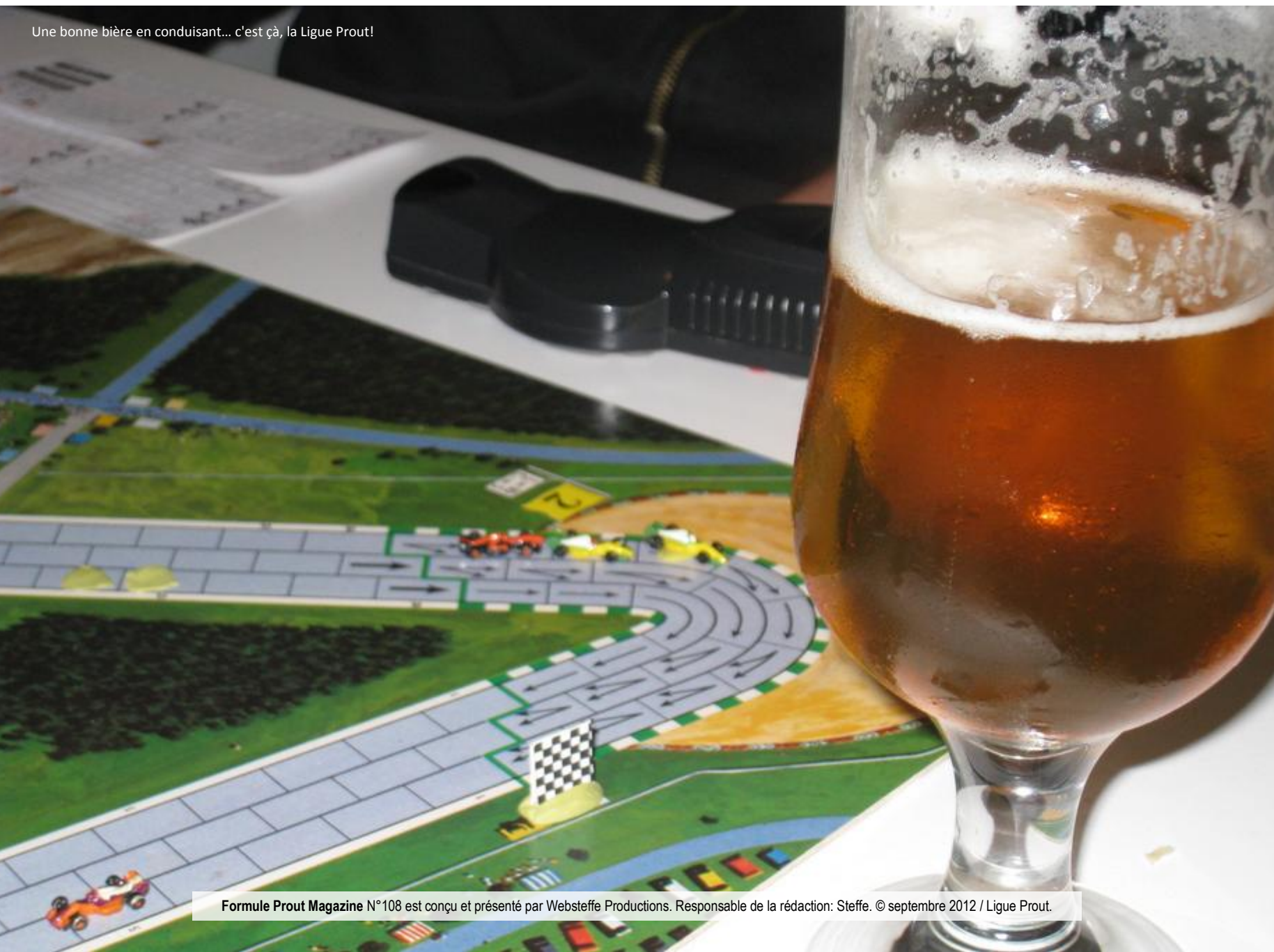
Une bonne bière en conduisant... c'est ça, la Ligue Prout!

Le président de la Fédération Incompétente de l'Automobile, Jean Toot, a fait savoir qu'il débiterait bientôt un voyage dans les deux Amériques afin d'y rencontrer les différents promoteurs pour mettre en candidature les circuits et les pays pour la prochaine saison du Championnat Prout FD1. Il aurait l'intention d'effectuer ce voyage d'affaire avec les patrons d'écuries pour augmenter ses chances de réussites. Des détails bientôt... ◀