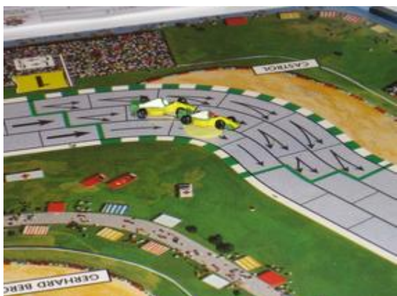
3 e tour, 1 er virage: les deux Circus, en seconde place, Poubel en tête.