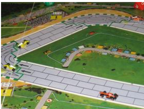
2 e tour, 3 e et 4 e virages: Mortis en tête suivi des deux Circus avec un coup de retard et Afonso avec deux coups de retard.