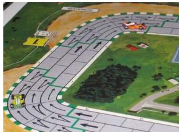
3 e tour, 8 e et 9 e virages: Mortis vers la victoire.