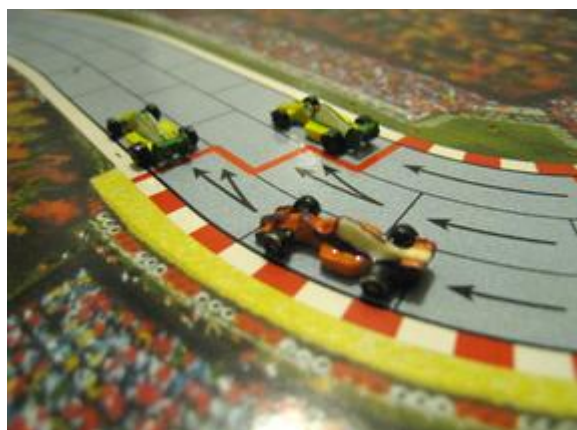
1 er tour, 4 e virage: la guerre continue, cette fois Mortis derrière les deux Circus.