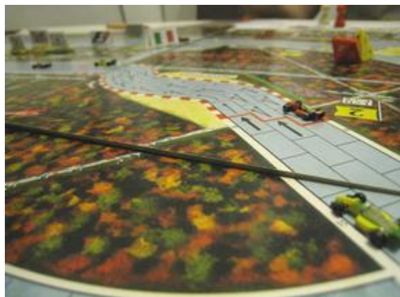
2 e tour, 5 e virage: Mortis en tête suivi de Poubel, Rotten vient de passer devant Afonso qui vient de manquer encore une fois son entrée!