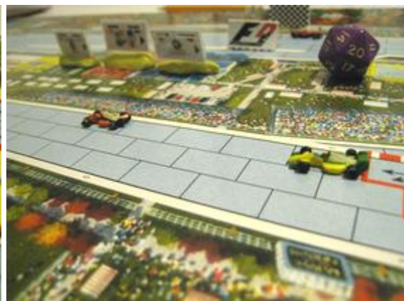
3 e tour, sortie du 5 e virage: Mortis en tête devant Poubel, ça ne changera plus jusqu'à la fin!