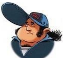
LEROGUE CHEF MÉCANICIEN