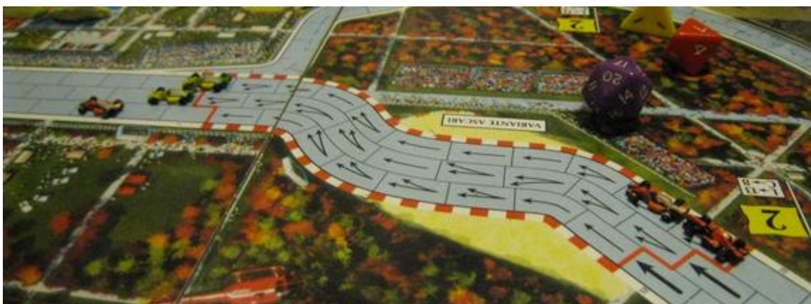
1 er tour, 5 e virage: second arrêt pour le groupe de tête, Mortis en 1 er place. Derrière, en premier arrêt, Rotten et Electra (Nightmare-Mercredez).