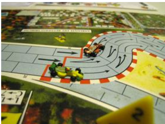
3 e tour, 1 er virage: toujours la lutte entre Mortis et Poubel.