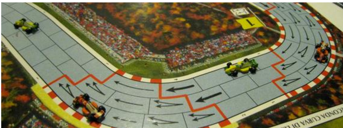
2 e tour, 2 e virage: Afonso vient de manquer son entrée dans le virage. Poubel en première place devant Mortis. Rotten dans le 1 er virage.