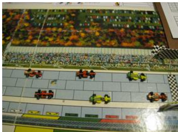
1 er tour, ligne de départ.