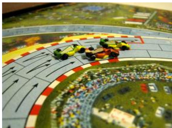
1 er tour, 6 e virage: toujours la course pour la tête, Poubel (Circus) en tête et Mortis toujours entre les deux Circus.