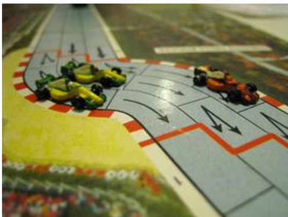
1 er tour, 2 e virage: Mortis (Dungeon-Circus) en tête avec les deux Circus derrière.