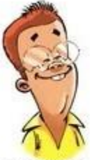
FRANGS B STAGIAIRE INGÉNIEUR