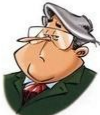
VILIN FÜRHER LE PRÉSIDENT