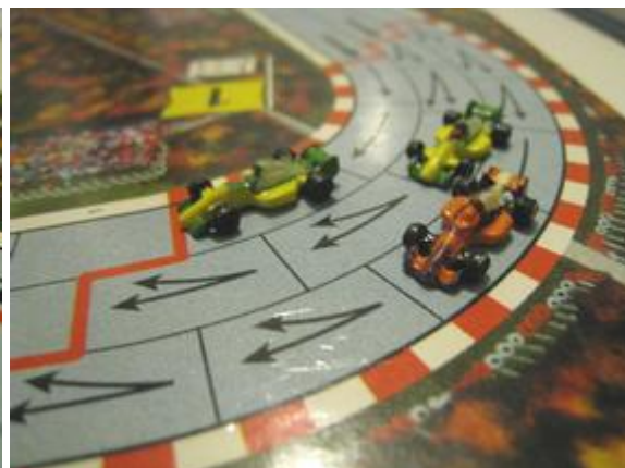
1 er tour, 3 e virage: mince avantage pour Afonso (Circus), Mortis entre les deux Circus.