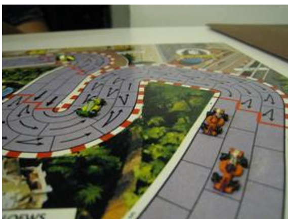
2 e tour, 5 e virage: les dugeons dominent. À son tour, Afonso perd 1 coup sur les meneurs, Poubel est à 2 coups.