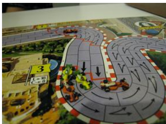
1 er tour, 5 e virage: la lutte se poursuit dans le groupe de tête, Pymagylon passe devant.