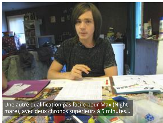
Une autre qualification pas facile pour Max (Nightmare), avec deux chronos supérieurs à 5 minutes...

Mais peu importe, les autres participants sont bien là, et Dungeon espère bien empêcher Circus de repartir avec la victoire. En attendant, l'objectif d'Yves sera d'empêcher Circus d'obtenir la pôle. Avons-le maintenant, ce premier objectif est déjà manqué!