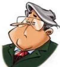
VILIN FÜRHER LE PRÉSIDENT