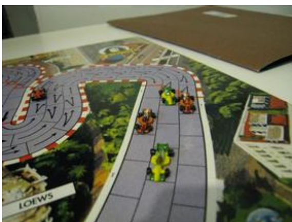
1 er tour, sortie du 5 e virage: Poubel prend la tête.