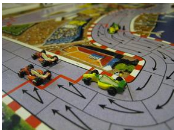
1 er tour, 9 e virage: les deux Dungeons passent devant Afonso. Poubel perd 1 coup sur le groupe des meneurs.