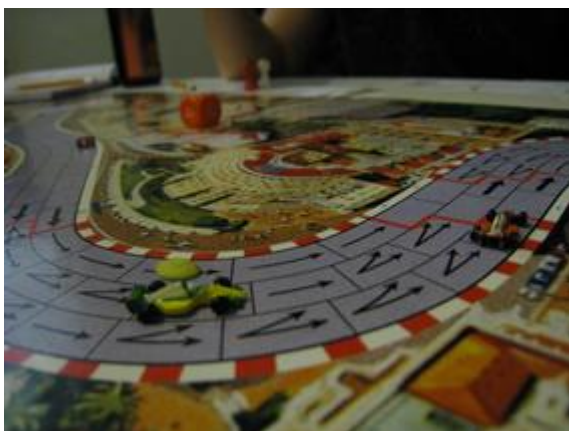
3 e tour, 2 e virage: Rotten devant Afonso, les deux pilotes dans le même coup.