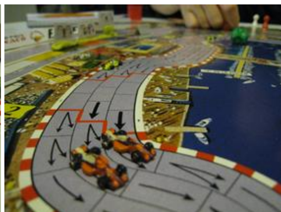
2 e tour, 9 e virage: lutte pour la tête entre les deux pilotes Dungeons.