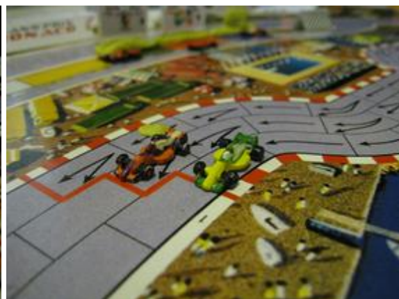
3 e tour, 8 e virage: Rotten devant Afonso, mais les pneus de Rotten sont finis.