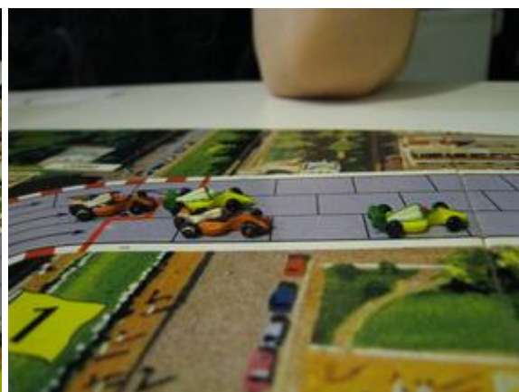
1 er tour, 3 e virage: Poubel en avant, Rotten, Afonso et Pymagylon.