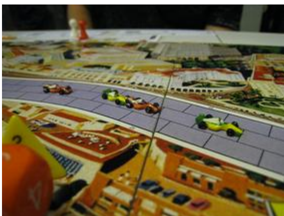
1 er tour, avant 3 e virage: Afonso (Circus), Rotten (Dungeon-Circus), Poubel (Circus) et Pymagylon (Dungeon-Circus).