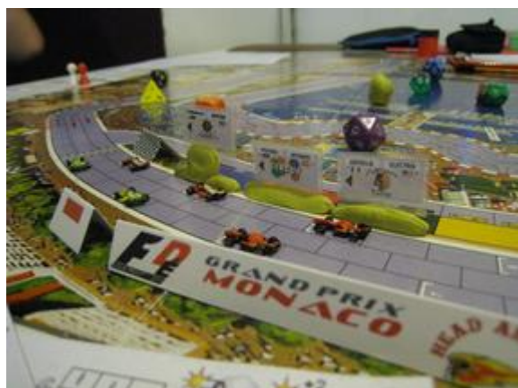
Ligne de départ avec publicités.