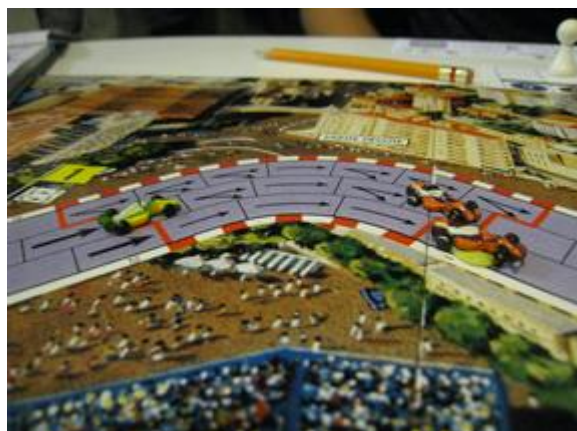
3 e tour, 1 er virage: Afonso rejoint les deux Dungeons.