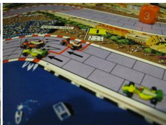
1 er tour, 7 e virage: Pymagylon devant Afonso.