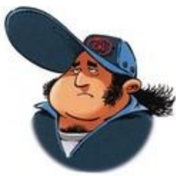
LEROGUE CHEF MÉCANICIEN