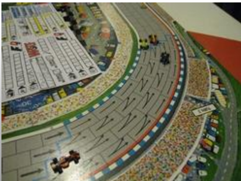
7 – 3 e tour, 2 e virage: Tagpiani (Wolf) prend avantage sur Tressy (Circus). Derrière, Estella (K&D) suit devant Inconnu (Dungeon).