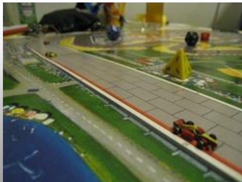
8 – 3 e tour, sortie du 2 e virage: Tagpiani vient d'avancer, Tressy ne parviendra pas à le dépasser.