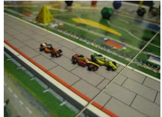
6 – 3 e tour: Tressy (Circus) est sur le point de se faire dépasser par Tagpiani (Wolf) alors que Inconnu (Dungeon) suit derrière.