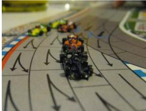
2 – 1 er tour: Mortis (K&D) vient de passer les deux voitures Dungeons et les deux Circus.