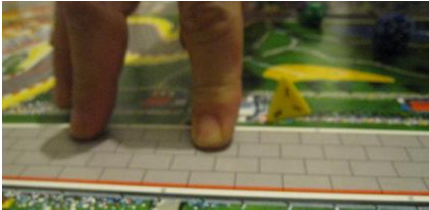
Un bonhomme tout nu sur le circuit d'Indianapolis? Ben non, juste des doigts!