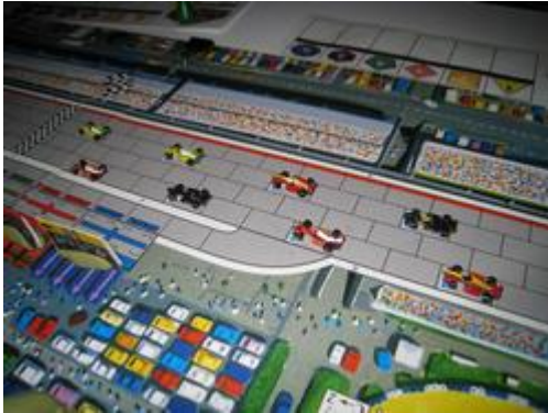
1 – Départ: Les voitures sont prêtes...