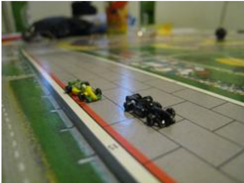
4 – 1 er tour: Lutte entre Mortis (K&D) et Tressy (Circus).