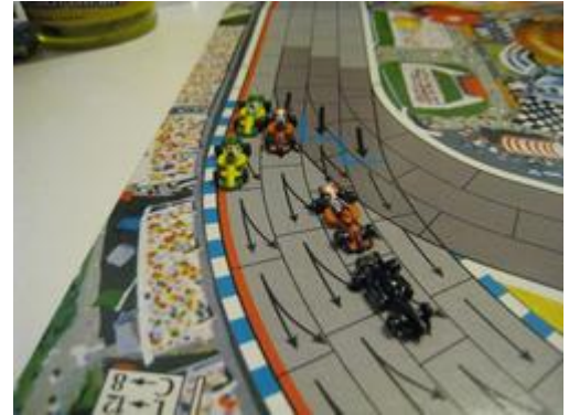
3 – 1 er tour (bis): Angle différent.