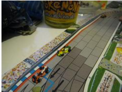
5 – 2 e tour: Lutte entre Inconnu (Dungeon) et Nelson (Circus) pour la 3 e place.