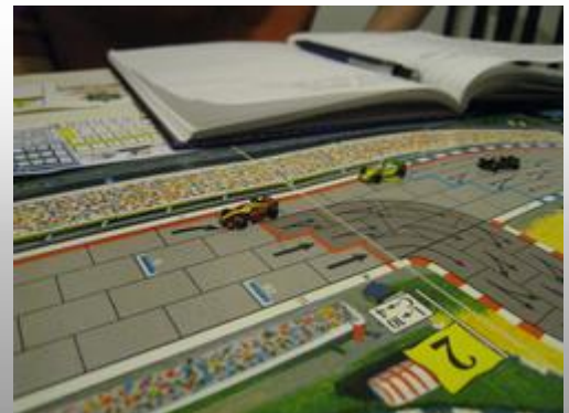
9 – 3 e tour, dernier virage: Tagpiani sort au maximum, empêchant toute chance à Tressy. Estella ne parviendra pas à terminer dans le même coup que les deux pilotes précédents.