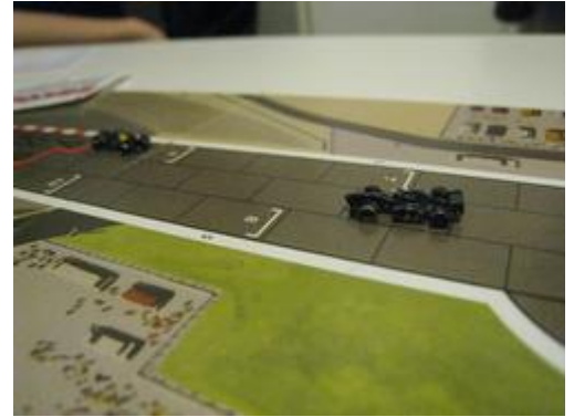
6 – 2 e tour: tête-à-queue pour Mortis.