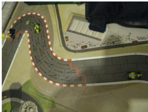
8 – 3 e tour: abandon pour bris moteur pour Mortis, les deux voitures Circus passent.