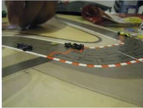
5 – 2 e tour: Tressy derrière les deux voitures Kill&Destroy.