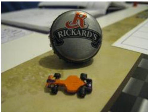
7 – Conduite + bière... voilà où ça nous amène!