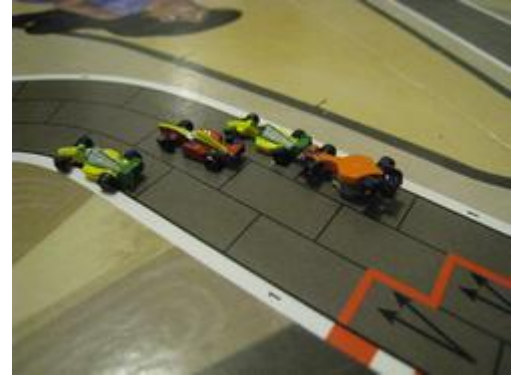
3 – 1 er tour, sortie 2 e virage: accident pour Pyrmagylon suite au blocage de Nelson.