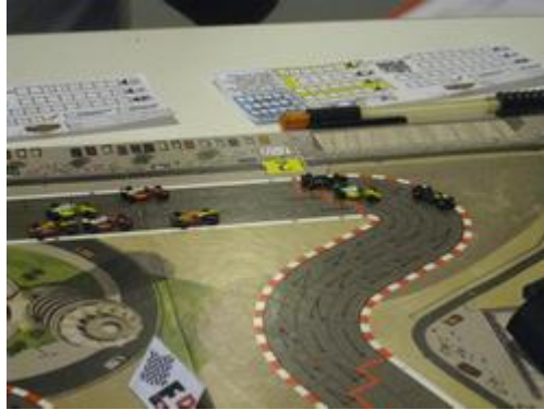
2 – 1 er tour et 1 er virage.