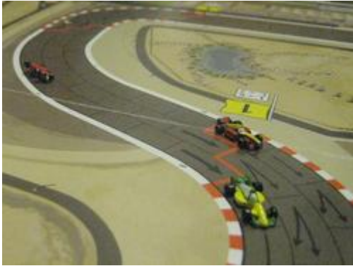
4 – Tressy devant Taggiani et Inconnu: les derniers.