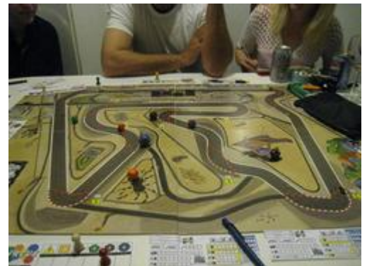
9 – Le circuit de Sakhir dans toute sa splendeur!