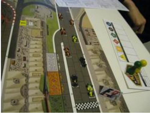
1 – La grille de départ.