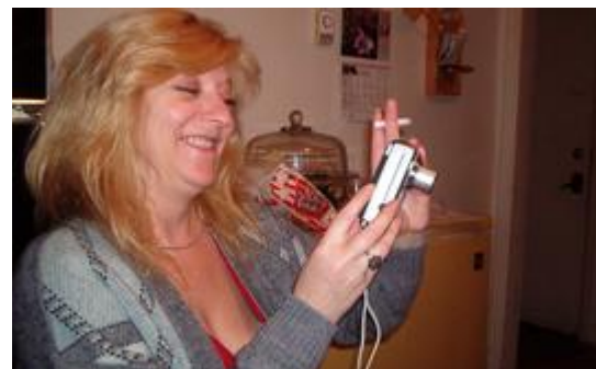
Par l'absence d'Yves, Francine s'est improvisée photographe...