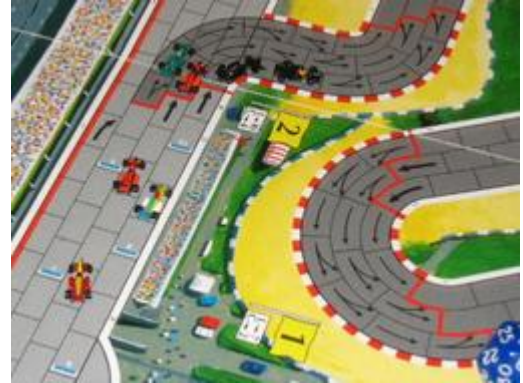
2 – Tour 1, virage 1: 4 pilotes entrent dans la courbe, la compétition sera féroce!