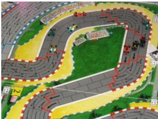
3 – Tour 1, virages 1, 2 et 3: Un mur se forme avec 2 K&D et Pymagylon de Dungeon.