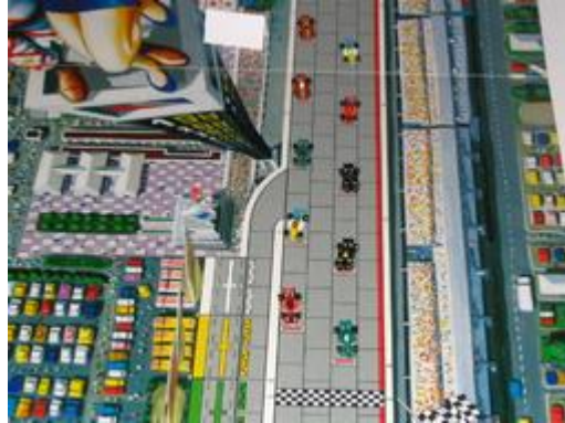
1 – Départ aérien: Avec un étrange effet d'optique avec la tour!!