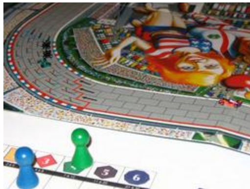
4 – Tour 1, virage 8: Le peloton de tête perd un joueur: Pymagylon doit ralentir.