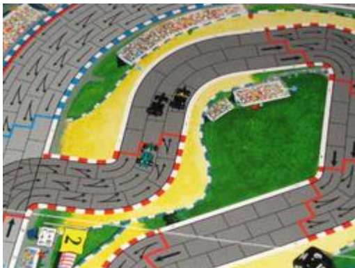
6 – Deuxième tour: Le nouveau peloton de tête en début de 2° tour.