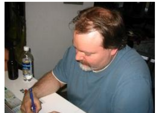
Steffe vient de perdre Tressy!

Aucun changement pour Nelson qui demeure toujours bon dernier, avec un coup de retard sur Onsor (Wolf-Mercredez).