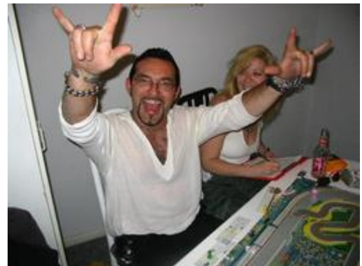
8 – Et de 4: K&D encore vainqueur pour une 4° fois de suite cette saison!!