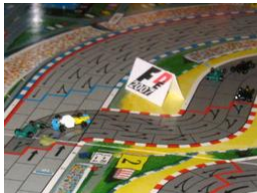
7 – Tressy out: Au début du 3° tour sur TdR!