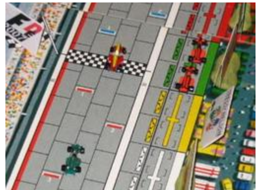
5 – Double arrêt aux puits pour Dungeon: Le premier tour a été très éreintant!