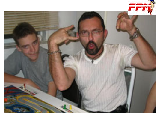
Et une victoire pour Herman et K&D, un bon placement pour le championnat.