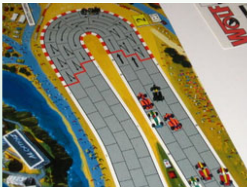
2 – 1 er tour, 1 er virage: Titan est en avant et le restera jusqu'à la fin et les autres se battront en vain!