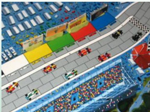
1 – Départ aérien: les voitures regroupées en belle lignes et couleurs.