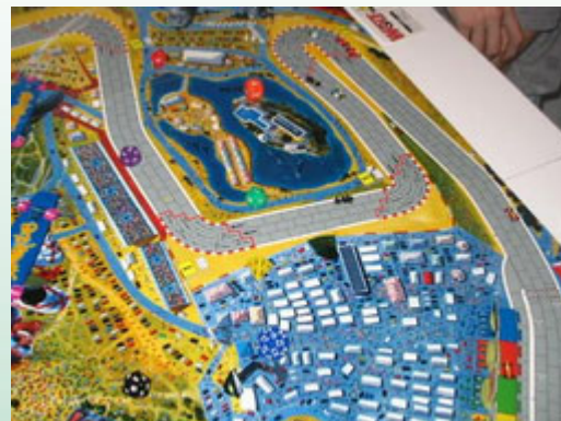
3 – Début du 2 e tour: quelques débris sur la piste. Ce sont les seules choses qui ont changé. C'est un peu zzzzzzzz comme course.