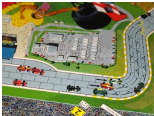
2 – 1 er tour, 1 er virage: Teddy est bien en avant. Il y aura une lutte pour les autres places. Nelson est trop loin encore pour apparaître sur la photo.