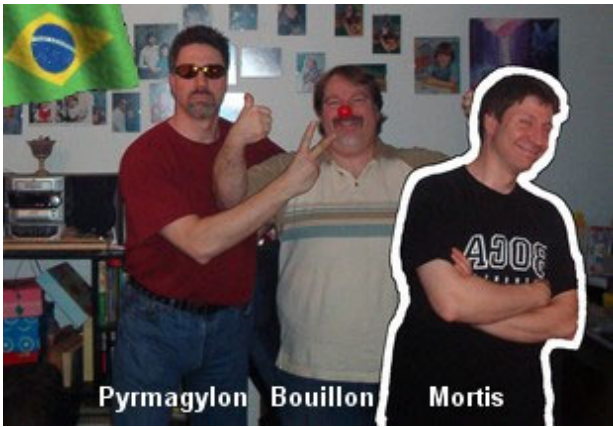
Pyrmagylon Bouillon Mortis