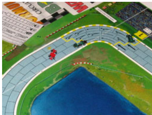
8 – Une autre victime: Wilfils perd ses chances de podium en terminant sa course sur une TdR.