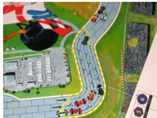
3 – Les deux pelotons: les pilotes sont bien regroupés, pour le reste de la course...