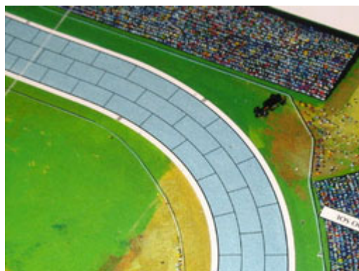
5 – Bourreau out: cette courbe a été fatale pour 2 pilotes; en premier, LeBourreau.