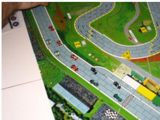
1 – Départ aérien: ça ne restera pas longtemps comme ça.