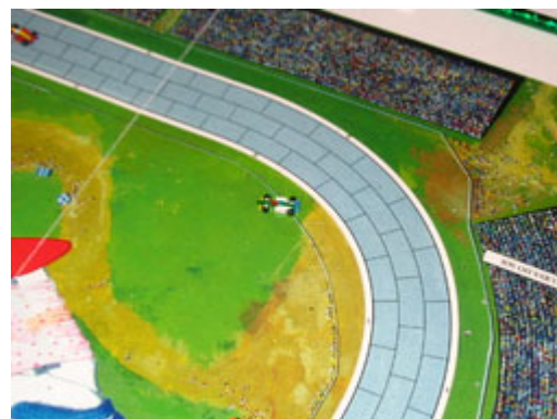
6 – Virage mortel: le coup suivant, c'est au tour de Nelson de subir une sortie de piste!