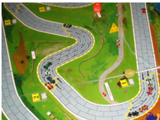
4 – 1 er tour, 3 e et 4 e virage: Mortis ne peut entrer dans la 3 e courbe alors on le voit loin en arrière! Les autres rient en avant!