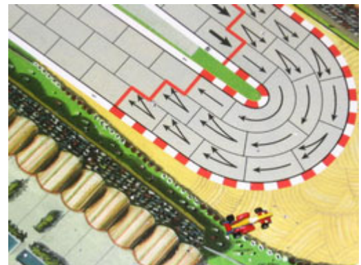
9 – Sortie de piste de Wilfils: ceci à 2 coups de la fin de sa course...