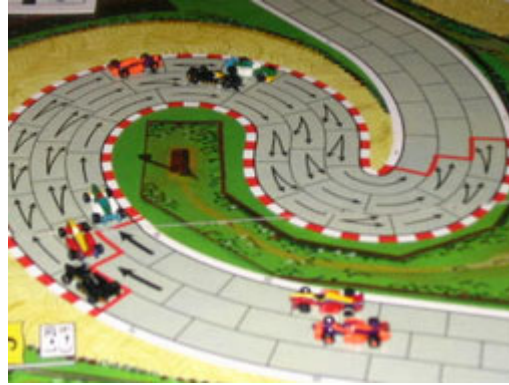
2 – 1 er tour, 1 er virage: les pelotons sont formés, du moins, pour le 1 er tour!