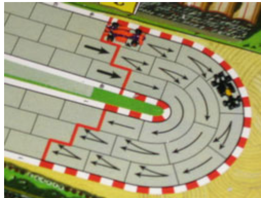
5 – 1 er tour, 6 e virage: les meneurs ne sont plus que 2.