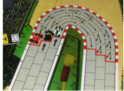
3 – 1 er tour, 2 e virage: ça joue dur pour garder les devants.