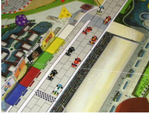
1 – Départ aérien: la ligne de départ.