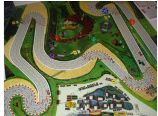
6 – Allure du 2 e tour: il y a de grandes distances entre les pilotes.