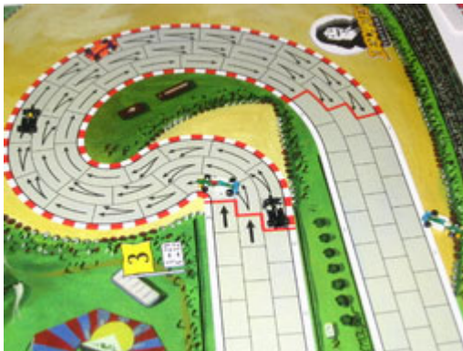
4 – Sortie de piste de Bouillon: on voit le pilote de Circus terminer sa course dans le gravier.