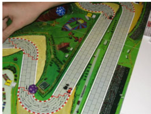
8 – Meneurs du 3 e tour: ils sont tous dans le même coup!