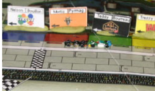
Arrêt tragique pour Nelson, bloqué dans les puits par le Bourreau.

Bourreau à un coup derrière les meneurs. Quelques coups plus tard, c'est au tour de Mortis (DMS) d'effectuer une sortie de piste.