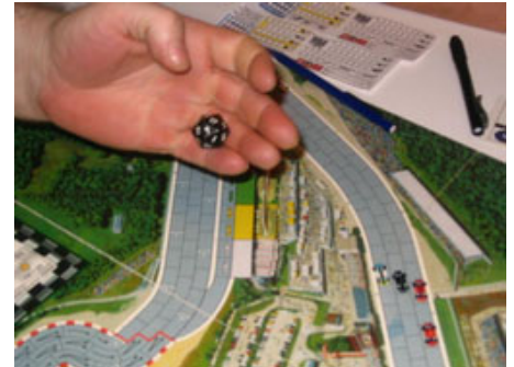
6 – Lancer collision.