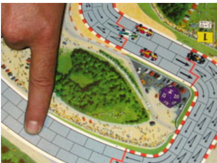
7 – Coup suicidaire de Teddy (sera réussi).