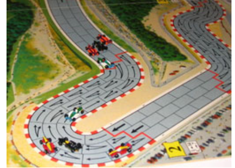
3 – 1 er tour, virages 2 et 3 : Les pelotons sont formés ça joue serré!!