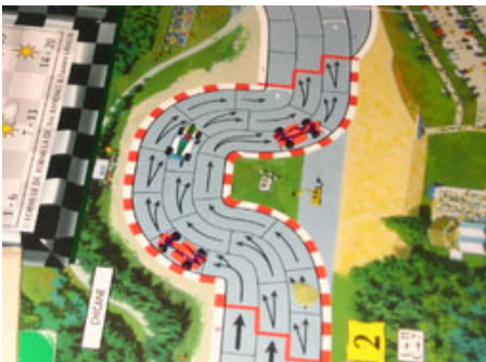
10 – Dernier virage : Xur est bien placé pour sortir en 4e. Nelson et Mortis doivent passer en 3 e ...