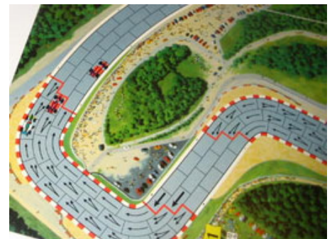
9 – 3 e tour, 7 e virage : DMS prend l'avantage sur Nelson!