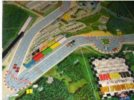
5 – Fin du premier tour : Les DMS sont encore seuls en avant et le seront pour tout le 2e tour.