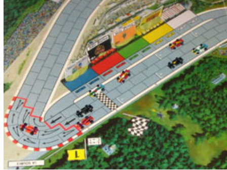
2 – 1 er tour, 1 er virage : Les DMS sont en avant! Ils seront rejoint par Nelson et LeBourreau.