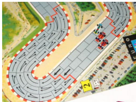
8 – 3 e tour, virages 3 et 4 : Une lutte propre à trois est commencée!