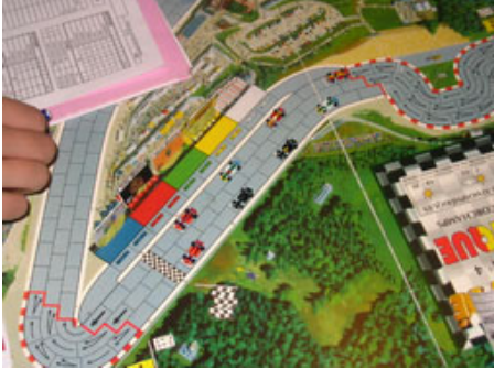
1 – Départ aérien : Pour vos beaux yeux, le départ aérien et la première ligne toute DMS.