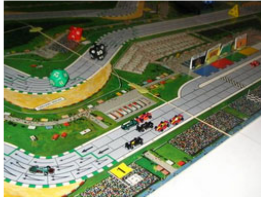
2 – Le départ est lancé : Au fond, Pyrmagylon de DMS, victime d'un mauvais départ!