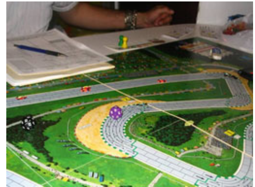
4 – 1 er tour, 3 e -4 e -5 e courbe : Déjà, les pelotons s'effilochent.