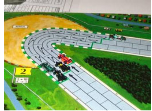
3 – 1 er tour, 2 e courbe : Arsenic33 en avant, les autres en arrière. Ce sera l'allure de la course.