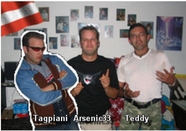
Tagpiani Arsenic33 Teddy