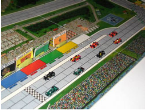
1 – Départ aérien : Une belle vision permettant de voir les puits.