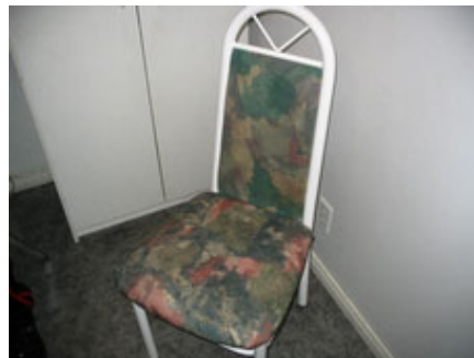
La chaise "vide" de Steffe!