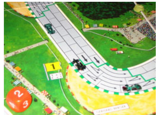
6 – Drame en fin de course : Vers la fin de la course, LeBourreau fait un tête-à-queue et cède la 2 e place à Tagpiani.