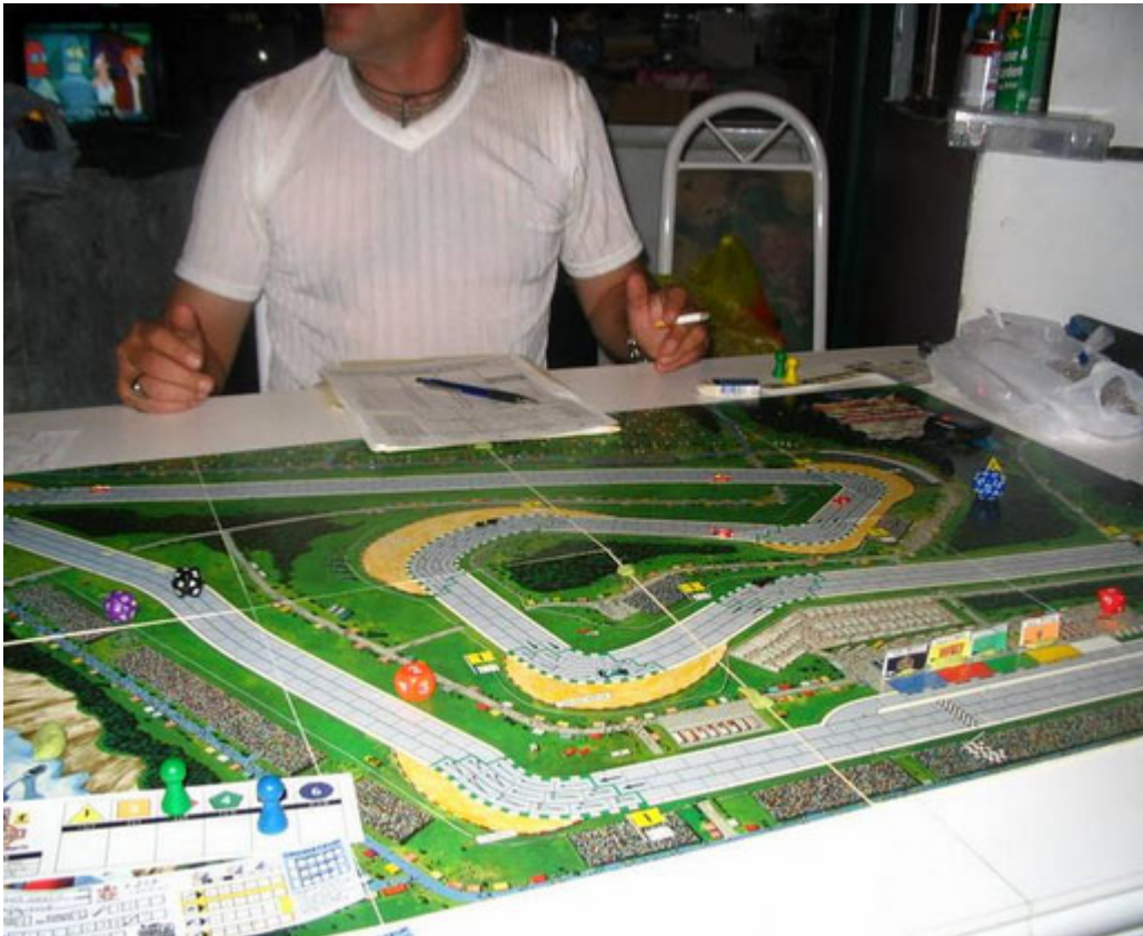
5 – Allure générale du 2 e tour : En arrière plan, la gang de Futurama!