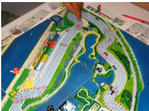
7 – 2 e tour: ... les pelotons commencent à s'espacer un peu plus.