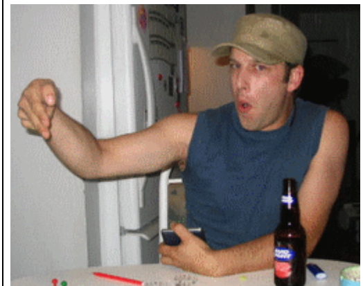
Françis (Weedheater-Penault) célébrant le doublé de ses voitures.

Victoire facile pour Tagpiani, son coéquipier Arsenic33 terminant 2 e . Le Bourreau complète le podium de ce Grand Prix du Canada 2006.