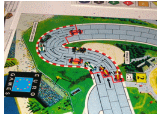
3 – 1 er tour, 1 er virage, et les autres: Ceux qui vont se battre pour la 3e place.