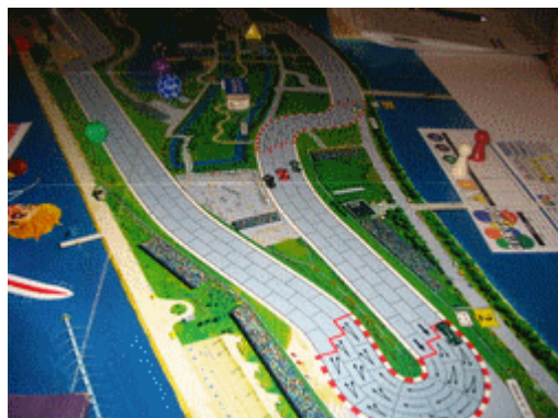
8 – Fin du 2 e tour: Une belle vue d'ensemble qui nous fait regretter, les humains, de ne pouvoir voler!!