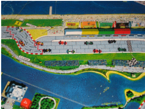
1 – Départ aérien: Comme d'habitude, à la demande générale.