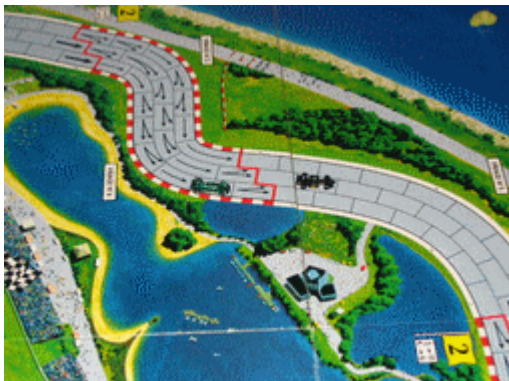
4 – 1 er tour, les meneurs: Ils vont se suivre pendant un bon bout de temps, ces deux-là!!