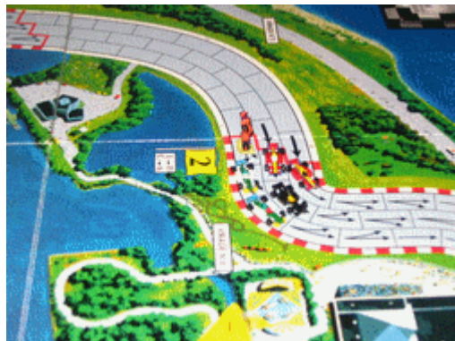
5 – L'accident de Pyrmagylon: Il a manqué de frein (juste 1) et c'était déjà la fin pour lui!