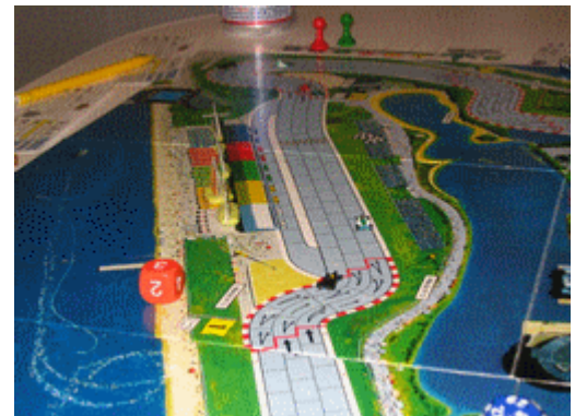
6 – Début du 2 e tour: On remarque que les voitures Wolf ne sont pas dans la photo...