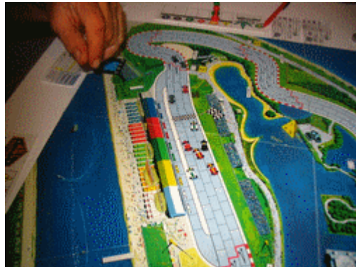
2 – 1 er tour, 1 er virage: Un des deux premiers pilotes sera le gagnant. Pour les autres, débrouillez-vous!!