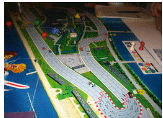
9 – Les retardataires vers la fin du 2e tour.