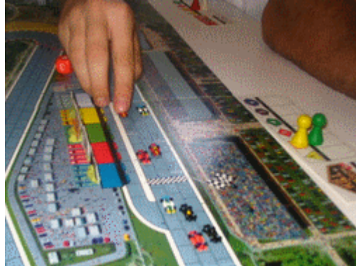
2 – Le départ: Nelson qui cale son moteur et Xur qui mène 1 des ses 2 coups dans la course!