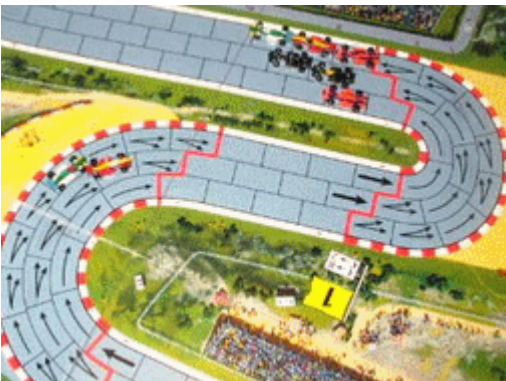
4 – 1 er tour, virages 3 et 4: 6 voitures dans le peloton de tête, dont une Wolf mais pas pour longtemps!