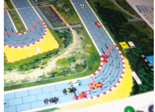
3 – 1 er tour, virage 1: 6 voitures sont dans le même coup!