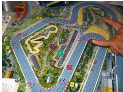
8 – Vers la fin du 3 e tour: la voiture K&D est bien en avant et c'est la bagarre entre Bouillon et les DMS pour les 2e et 3e places.