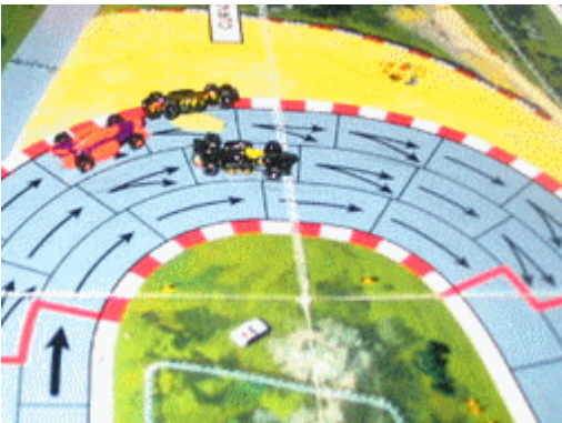
7 – L'accident de Bourreau: ...jusqu'à ce que Xur colle de trop près le pilote de K&D et l'élimine de la course au 2e tour.