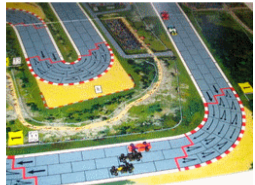
6 – 2 e tour, virage 1: seulement 3 voitures dans le même coup!! Jusqu'à...