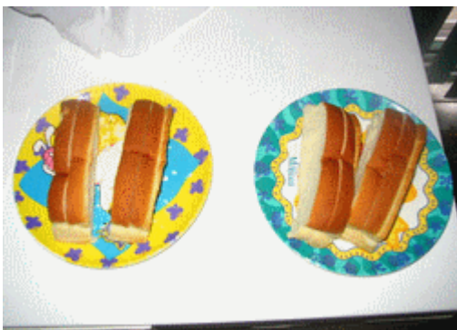
Préparation spéciale pour l'équipe DMS-Torrari...

Les qualifications se déroulent sous un splendide soleil. Les deux voitures Circus s'élèvent les premier et réalisent chacun un tour en 14 coups et rien d'extraordinaire dans les chronos. Les deux voitures K&D qui suivent dans l'ordre feront mieux avec des tours en 13 coups et les deux meilleurs chronos de l'épreuve: Circus devra donc partir au pire au milieu de la grille... déjà des nuages dans l'horizon de l'équipe de clowns!