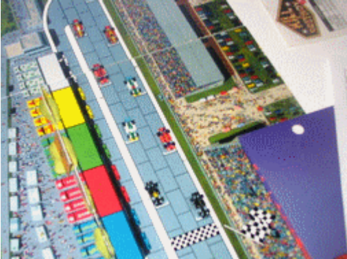
1 – Départ aérien: Traditionnelle photo de départ.