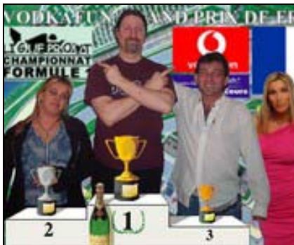
GRAND PRIX DE FRANCE (Magny-Cours, 8 mai 2004)

Cinquième épreuve de la saison 7 du championnat Prout FD1. Une course à l'honneur de l'écurie DMS et du pilote Le Bourreau qui célébrait sa seconde victoire dans les trois dernières courses. Mais aussi une course désastreuse pour Circus avec un accident (Inconnu) et une sortie de piste tragique (Nelson) à quelques mètres de la ligne d'arrivée.