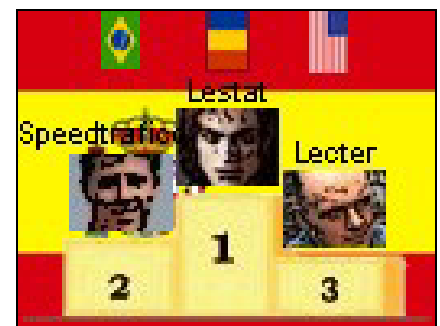
GRAND PRIX F3000 D'ESPAGNE (Jarama, 30 mai 2004)

Quatrième épreuve du championnat Prout FD3000.