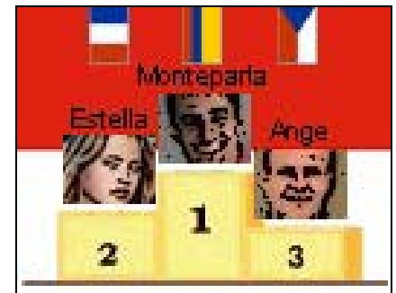
(Monte-Carlo, 15 mai 2004)

Troisième épreuve du championnat Prout FD3000.